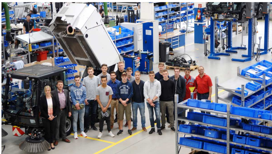
Unsere neuen Auszubildenden, September 2017

Der Bereich Operation Global am Standort St. Blasien gilt als einer der größten Ausbildungsbetriebe in der Region und bietet Ihnen entsprechendes Know-how für Ihre berufliche Zukunft. Dass die Ausbildung bei uns einen hohen Stellenwert einnimmt, beweisen die zahlreichen Innungs-, Kammer- und Landessieger in den letzten Jahren.