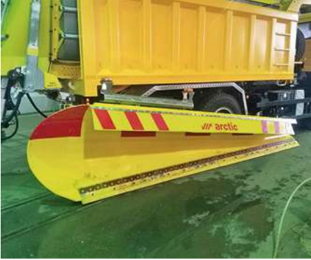
SHJ 216 J